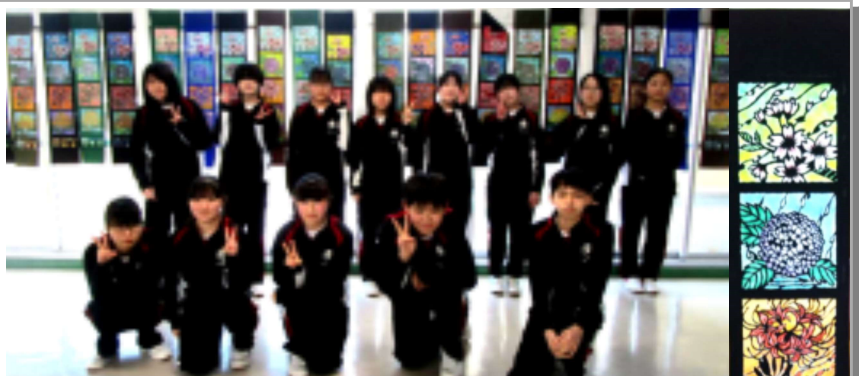
制作した美術部の生徒たち ~完成作品の前にて~